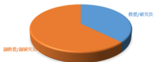
图 1-1 导师职称机构

本学位授权点现有研究生导师 8 人，其中正高职称 3 人，副高职称 5 人，45 岁以下的比例 72%，具有博士学位 8 人，比例 100%。