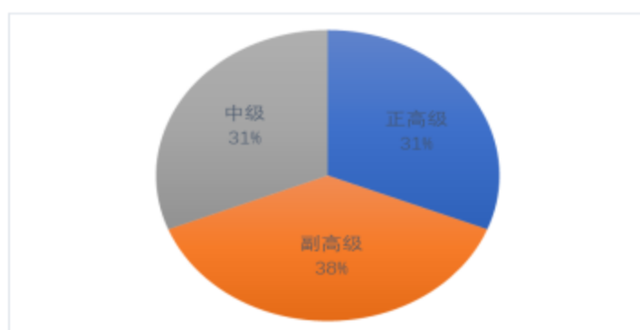
图 2-2 专任教师职称结构

专任教师有正高级职称 18 人，占比 31%，副高级 22 人，占比 38%，中级 18 人，占比 31%；其中，副高级以上专业技术职务的比例为 69%。