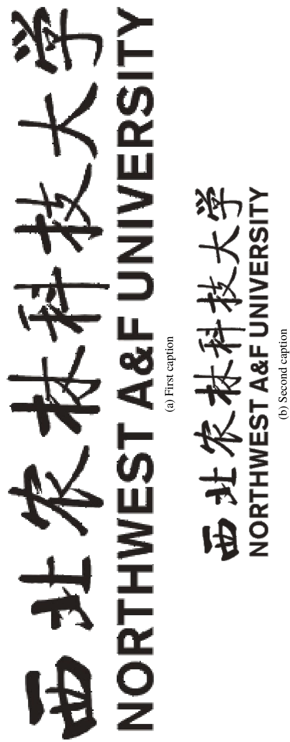
图 2-6 一幅占用完整页面的图片