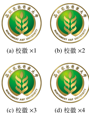
图 2-5 包含多张图片的插图