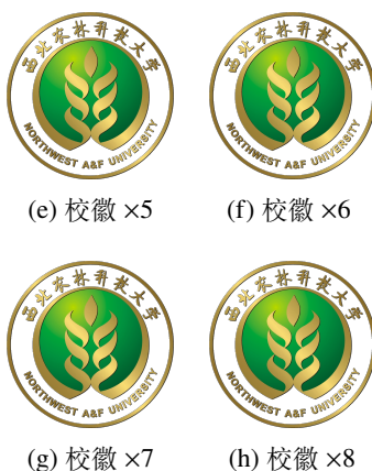
图 2-5 包含多张图片的插图（续）

复条目，需要一点点小技巧（设置图表目录标题为空）。建议将浮动位置指定为 t ，以确保分散至多页的图能占用整个页面，手工分页才能靠谱。效果可以参见图 2-5 的图 2-5f。